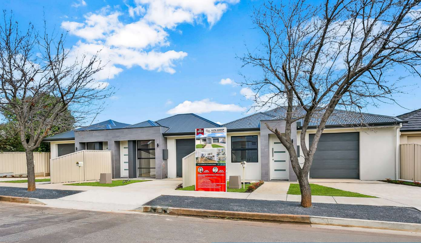
Seacombe Gardens (4 Reid Street)