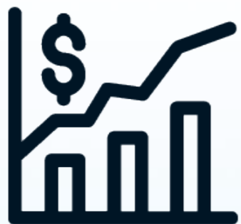
Ценные бумаги и фьючерсы