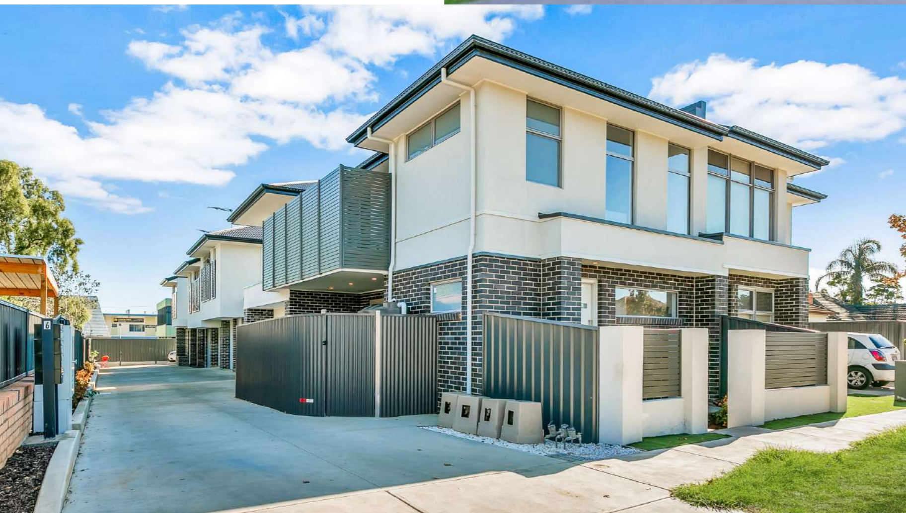
Tranmere (6 Glen Avenue)