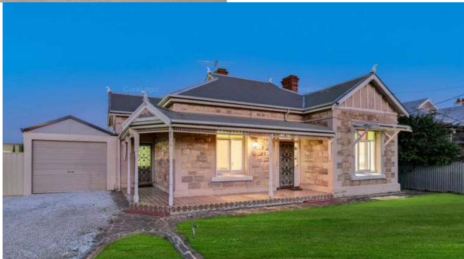
Brooklyn Park (1 Lysle Street)